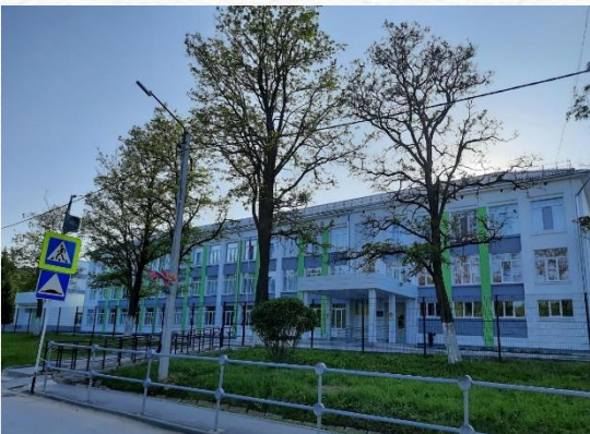
МКОУ СОШ МО СЛАВНЫЙ