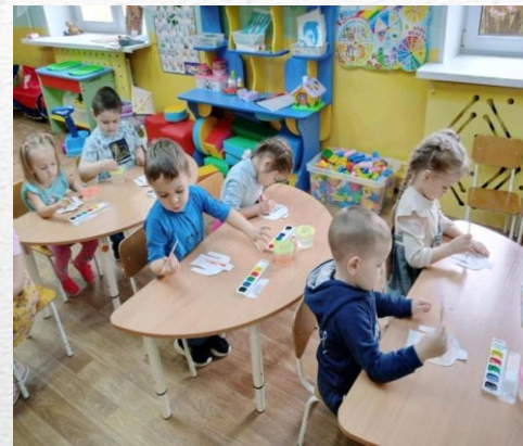
ДЕТСКИЙ САД МО СЛАВНЫЙ