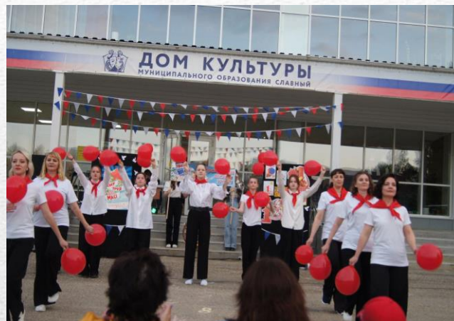
МКУ «ДК МО СЛАВНЫЙ»