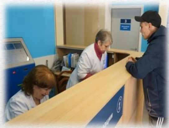
АМБУЛАТОРИЯ ПГТ. СЛАВНЫЙ