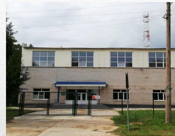
МКУ «ФОК МО СЛАВНЫЙ»